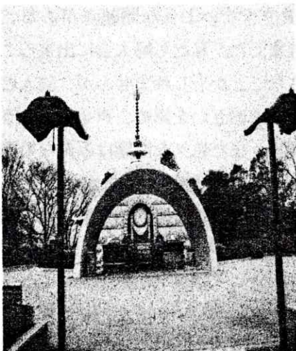
長島愛生園納骨堂